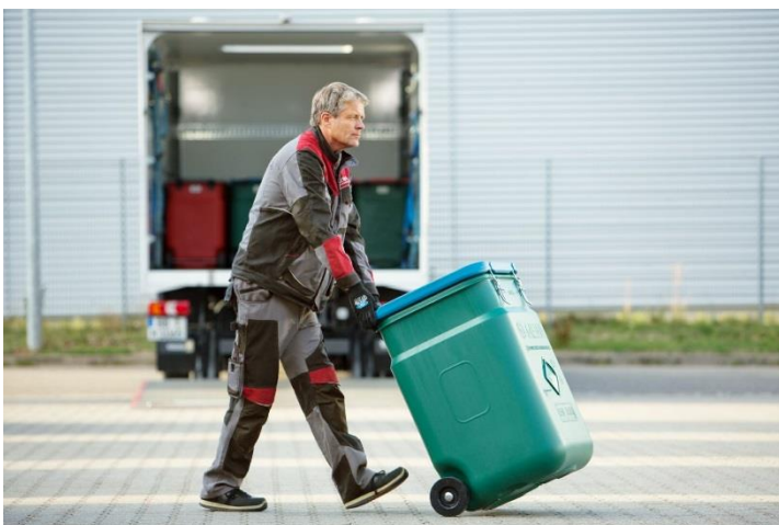
MEWA recoge y entrega sus paños de limpieza en los contenedores de Seguridad SaCon®