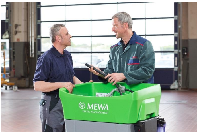
Un asesor de MEWA atiende a un operario del lavapiezas Bio-Circle