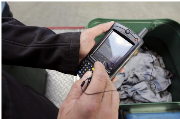
Los paños sucios se recogen en las instalaciones del cliente según al ritmo acordado