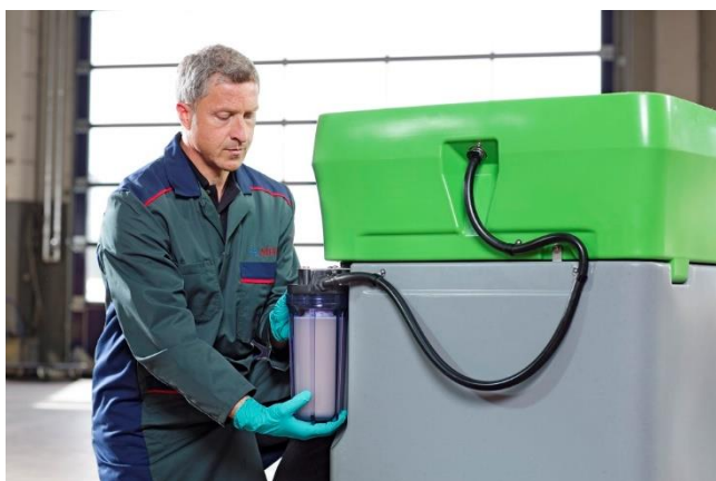
Los lavapiezas de MEWA disponen de un servicio de mantenimiento y un servicio de reparación urgente.